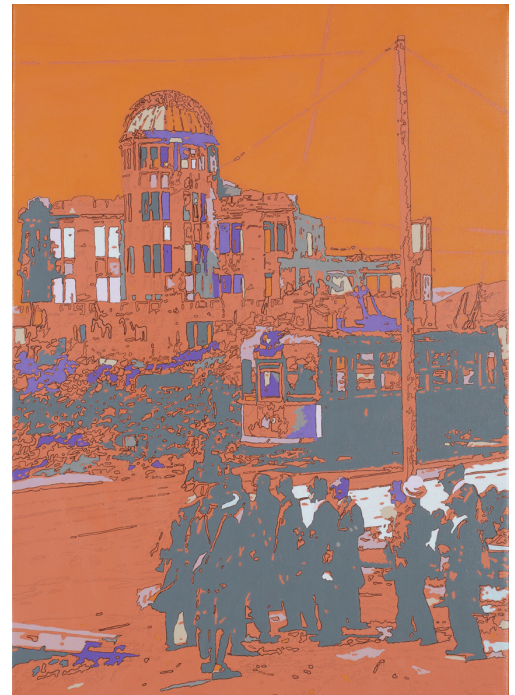
フェーシング・ヒストリーズ N.74 「Atomic series - オレンジドーム」(2015) 35×25cm、カンバスにインク、鉛筆、アクリル絵具