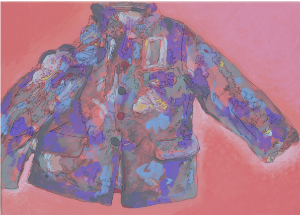
フェーシング・ヒストリーズ N.20 「Atomic series- ラジオアクティブ・ファッション」 (2015)、25×35cm、カンバスにインク、鉛筆、アクリル絵具