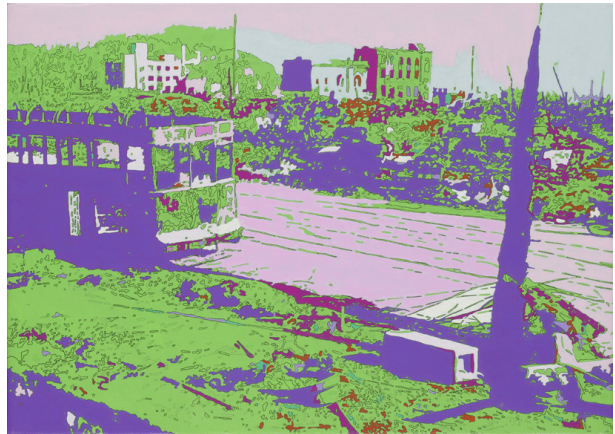
フェーシング・ヒストリーズ N.29 「Atomic series - 市電」 (2015) 25×35cm、カンバスにインク、鉛筆、アクリル絵具