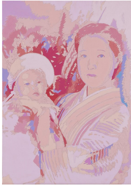
フェーシング・ヒストリーズ N.13 「母と子」 (2015) 35×25cm、カンバスに鉛筆、アクリル絵具