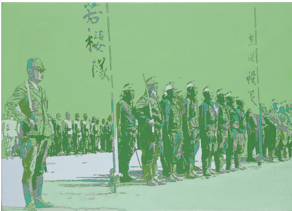
フェーシング・ヒストリーズ N.29 「整列 - 神風」(2015) 25×35cm、キャンバスにインク、鉛筆、アクリル絵具

今回は、烏丸の思いと祈りを100枚以上にも及ぶ小品のタブローやドローイングに託し、インスタレーションという形態で展示を構成します。入念に創り出される鮮やかで豊かな色彩や緻密な等高線のようなアウトラインは、時空を、そして現実とフィクションの境界を軽やかに飛び越え、日本とは何か？私たちとは何か？を観る者に静かに問いかけます。日本では、前回のミヅマアクション（ミヅマアートギャラリー／東京）以来、約5年ぶりの個展となります。どうぞご期待ください。