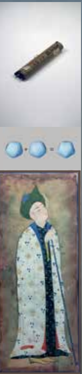
上：藤原貞幹／『集古図』巻1天文 寛政4年頃 (c. 1792)