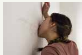
《Lemmon-2》 2016/Exchange Students Exhibition、ロンドン/レモン、紙/パフォーマンス(60分)