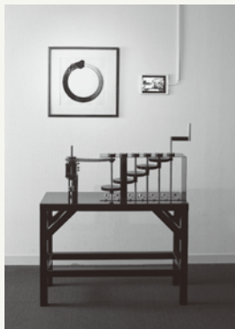
《円を描く》 2020/アルミ、鉄、ステンレス、ペンキ、ケント紙

2020.4.4 sat. - 5.17 sun. 京都市立芸術大学ギャラリー@KCUA 11:00-19:00 (月曜休館) 入場無料