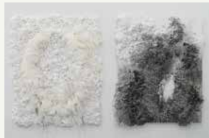
《尋牛/忘牛存人(十牛図より)》 2018/羊毛、頭髮、顔料、ウレタン、パネル

※菊池和晃作品には装置が含まれます。装置の稼働日は4/4(土)、4/25(土)、5/17(日)を予定しており、会期中のその他の日には稼働中の装置を捉えた映像が展示されます。 ※宮木亜菜作品では会期中の土日祝に作家自身を含む人がインスタレーションの一部となり、その度に作品形態が変化していきます。