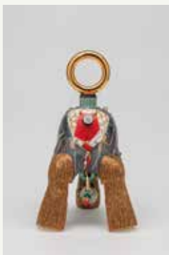
《緋華飾 アケカシヨク》 2019/磁土、釉薬、金彩顔料、組紐