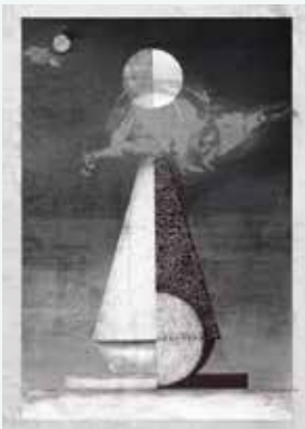
《クロコワニニキケンダム》