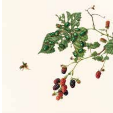
菱木明香 《徒然の草 ブラックベリーとアオドウガネ》 2021