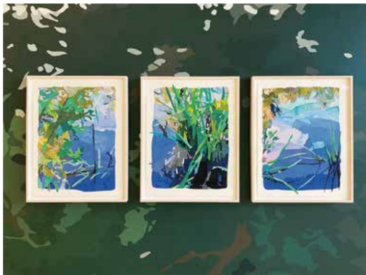
リース直美《Borrowed Landscape VIII (warm temperate climate, water/sound contained climate summer)》(部分) 2021