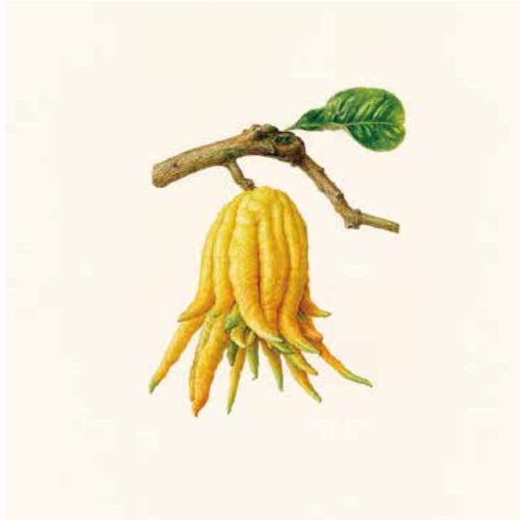
菱木明香《徒然の重・仏手柑》2021