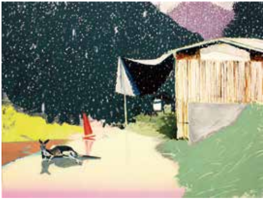
栗田咲子 《白のカンガルー》 2009