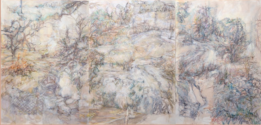
阪本結 Yui Sakamoto